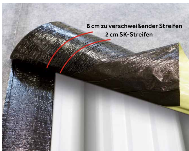
8 cm zu verschweißender Streifen 2 cm SK-Streifen