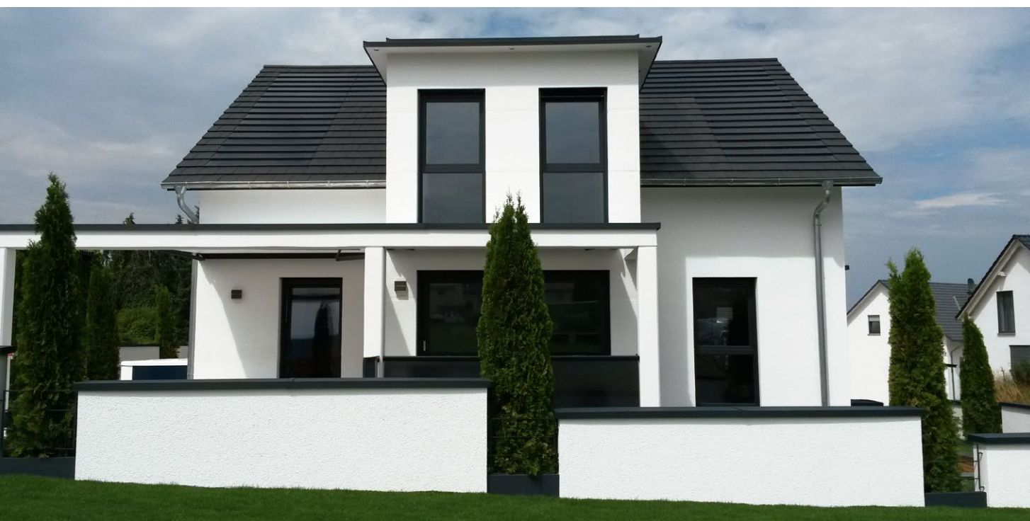
PV Premium: hohe Leistung, hervorragende Optik.