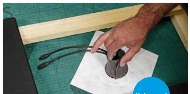
Toepassing Doorvoer manchette zelfklevend