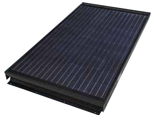
Monier PV InDaX systeem module

Voor de laatste up-to-date gegevens / productspecificaties verwijzen wij u naar onze website.