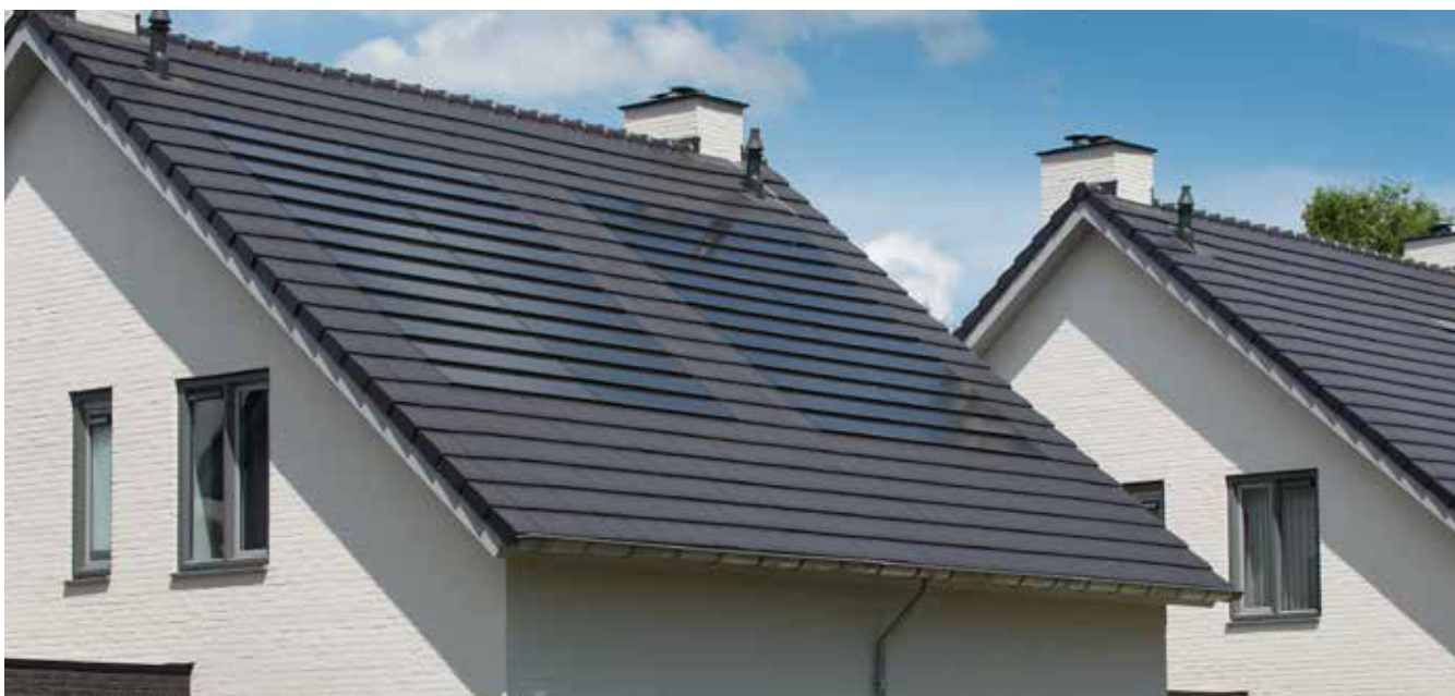
Signy double black mat i.c.m. Monier PV Premium systeem

De PV-systemen van BMI Monier worden geleverd inclusief omvormers die ervoor zorgen dat de opgewekte zonnestroom (gelijkspanning) omgezet wordt naar wisselstroom. Het exacte ontwerp van het systeem kan per project worden gemaakt door de adviseurs van BMI Monier.