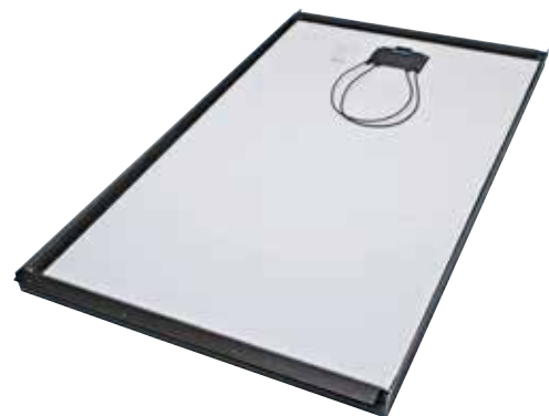
Monier PV InDaX systeem module achterzijde

Voor de laatste up-to-date gegevens / productspecificaties verwijzen wij u naar onze website.