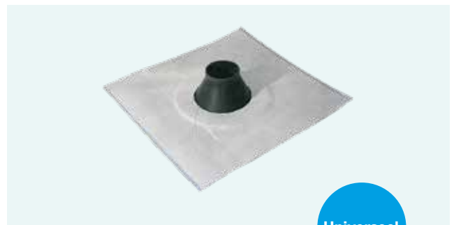
Doorvoer manchette zelfklevend

De opstand is hoog genoeg om eventueel langskomend vocht te keren. De diameter van 50-70 mm is voldoende voor de doorvoer van kabels en (geïsoleerde) zonnethermische leidingen.