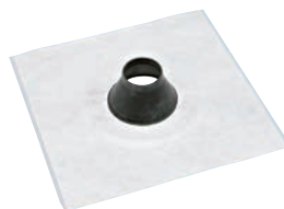
Divoroll Solar- Dichtmanschette