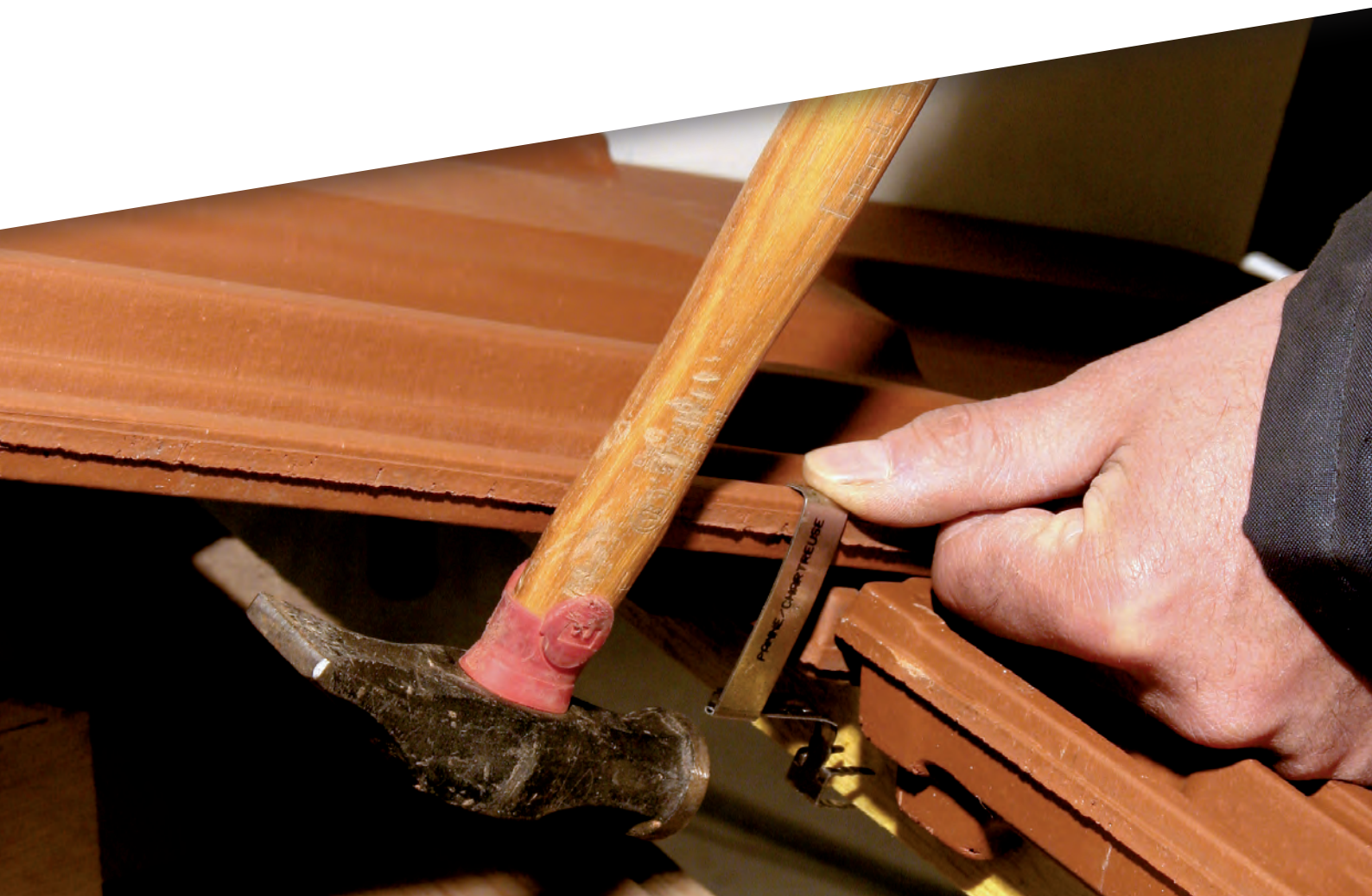
Crochet de fixation de tuiles à emboîtement