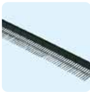
Vogelschroot / panlatprofiel