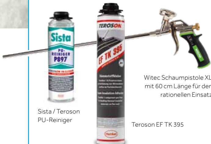
Sista / Teroson PU-Reiniger